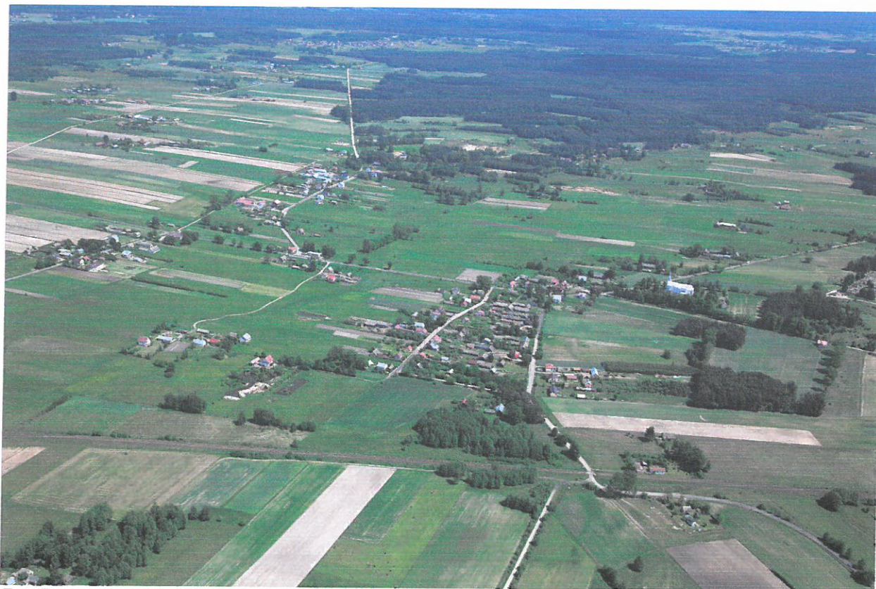
Fot. Rozproszona zabudowa wsi wsi Pogorzałki

Układ przestrzenny wsi Pogorzałki charakteryzuje się bardzo rozproszoną zabudową, zlokalizowaną przy drogach gminnych prostopadłych do drogi powiatowej nr 1385B Dobrzyniewo – Nowosiółki. Ten rozproszony układ przestrzenny sprawił, że mieszkańcy poszczególne części wsi zaczęli zwyczajowo nazywać: „Piaski”, „Kolejowa”, „Koniec”, „Dolina”, „Kłęcbudy”, „Podkozińce”. Są to takie nieformalne, ale mocno zakorzenione w tradycji lokalnej dzielnice wsi. Ich nazwy wywodzą się z historii wsi przedstawionej w pkt. 1.3