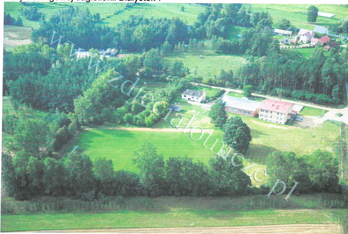
Fot. Widok na kompleks szkolno – sportowy. W najwyższym budynku piętrowym mieści się szkoła podstawowa, obok w drewnianym budynku wybudowanym w okresie międzywojennym mieści się sala widowiskowa i część pomieszczeń Wynajmowanych przez Jagiellonię Białystok. Najmniejszy budynek z białą elewacją wynajmowany przez klub (zaplecze socjalno – rekreacyjne ) i widoczne boisko również wynajmowane przez klub.