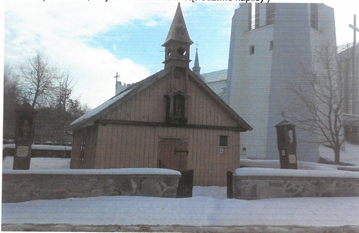
Fot. Zabytkowa kaplica (widok od strony drogi powiatowej Dobrzyniewo– Nowosiółki )

We wsi Pogorzałki do zabytków kultury materialnej należy kaplica przydrożna wybudowana w 1863 roku, wpisana do rejestru zabytków ( nr rej. 390 z 14.02.1977 ). Budynek drewniano-murowany, rozbudowany w 1905 r. oraz 4 kapliczki świętego Jana Nepomucena, w tym 2 ustawione w sąsiedztwie kaplicy )